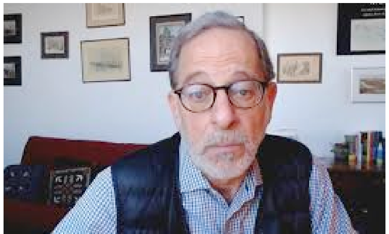
Rachid Khalidi geen aandacht voor de historische context van 7 oktober

Als de wereld Israël verder straffeloos zijn gang laat gaan zal de annexatie van (delen van) Gaza en de bouw van nieuwe joodse nederzettingen daar, gevolgd worden door een verdere kolonisering van de Westelijke Jordaanoever. Dat zal gepaard gaan met meer geweld. Een duister vooruitzicht voor 2025, maar er is weinig reden voor optimisme.