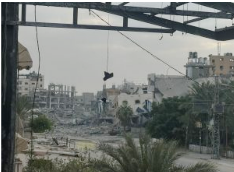
Huis Sadi Daboor verwoest.

Wat de watervoorziening betreft, het meest